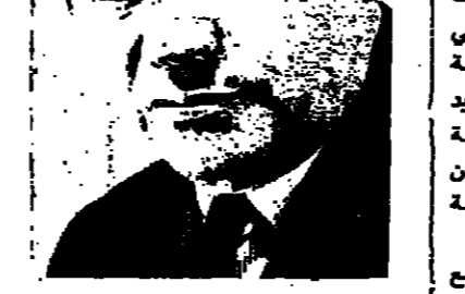
حيفا - من شفيق منصور - ينتخب وزير الصحة السيد اليمار شوستاك

اريجا - من مكتب الصحافه المتحد بنسبة حلول عيد الاضحى المبارك بوم